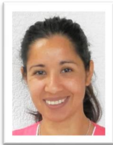
Puja LA GOUTTE