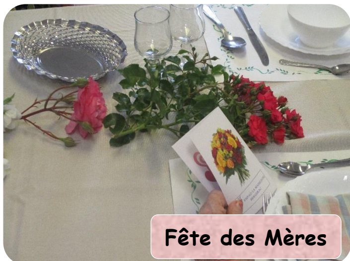
Fête des Mères

Chaque année, l'établissement souhaite apporter sa contribution à la fête des mères en offrant un cadeau et en profitant de l'occasion pour partager un repas festif. Cette journée remémore des souvenirs à chacune.